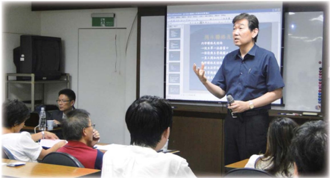
▲ 辛處長（立者）於 102 年企業經理人才培訓研習會講授課程

是有一群人默默的在協助我支持我。這些人是我的長官，我的同事，還有我的家人。雖然獲獎是個人在工作上獲得肯定，我也知曉這更應是公平交易委員會多年的施政與執法獲得肯認。此次獲獎謝謝評審委員，更感謝長官的提攜與厚愛、同仁鼎力協助與支持、家人的奉獻與鼓勵，我應將此項殊榮與大家共同分享。