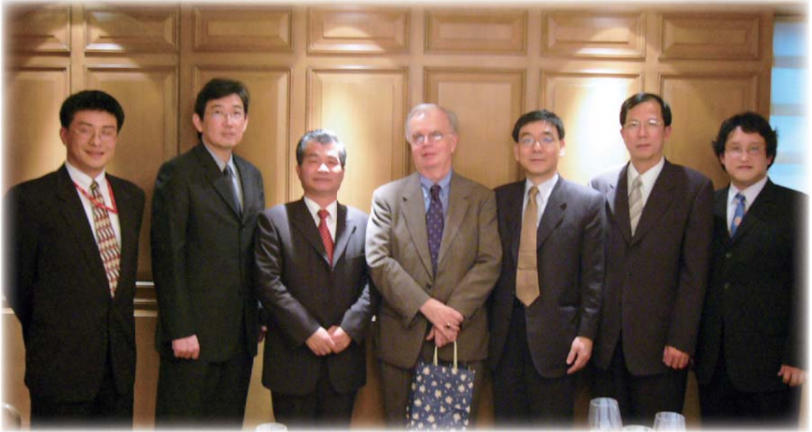
▲ 辛處長（左 2）辦理競爭法國際交流活動，與參加專家學者合影

法律事務處與 3 個分別掌理服務業、製造業，及不公平競爭行為的調查處。我有幸於 5 個業務處均有歷練，分別負責政策規劃、國際事務、研發管考、法制作業、行政救濟、調查專業等不同業務。從這些不同的工作崗位上所獲得的經驗，深深感受到機關業務能否順利推動，實有賴各部門間通力合作，因此在行政團隊中，認為誠意的溝通、耐心的說明、無私的付出，是完成任務時不可或缺的元素，也是我從事公務生涯每天的功課。