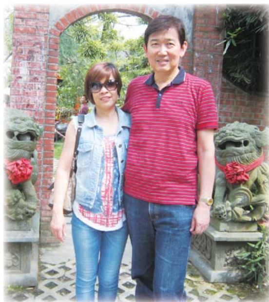
▲ 辛處長與夫人旅遊留影

有政策規劃難以兩全的憂慮猶豫、有創新突破豁然開朗的興奮雀躍、有人事更迭的不捨離情。心中感慨，凡走過必留下痕跡，故處事但求俯仰無愧，成功不必在我。